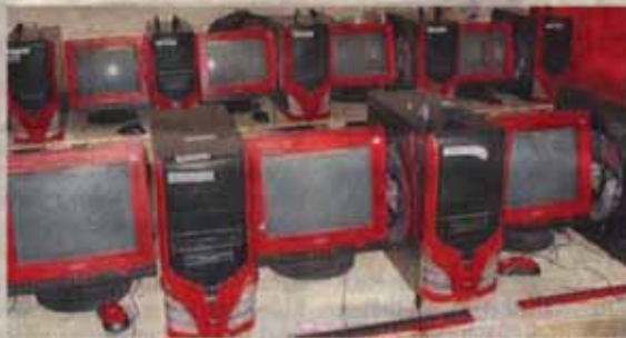
In diesem kleinen PC-Raum wurden die CBT-Programme entwickelt.

halte bekannt sein müssen, um einen regulären Schulabschluss auf den Philippinen zu erlangen.