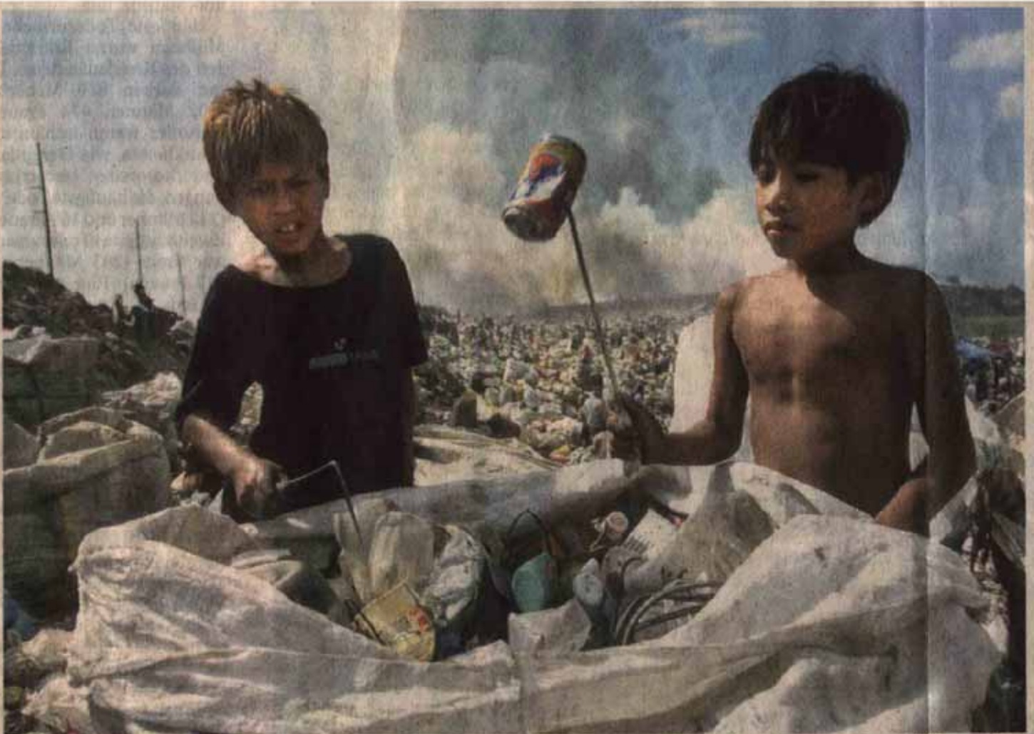
Die „rauchenden Berge“ mit ihrem Gift und ein Leben im Dreck. Ständig gibt's Schwelbrände auf Asiens größter Müllkippe. Einer Zukunft, die auf Müll gebaut ist, wollen die Weinfreunde etwas entgegensetzen.